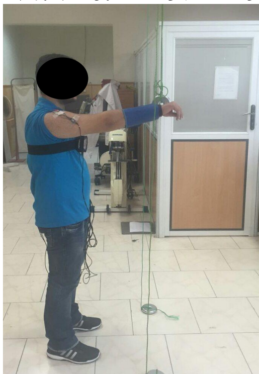
تصویر ۲. وضعیت افراد در هنگام انجام تست ۸

سرعت ممکن و تا زاویه ی کمترین ۶۰ درجه خم کردن شانه حرکت دهند. قبل از اجرای تست ، ۲ تا ۵ حرکت آزمایشی به منظور آشنایی فرد با سمت و سرعت حرکت انجام شد. در هنگام انجام ۳ حرکت اصلیه افراد گفته شد که اندام زبرین خود را در پاسخ به محرک شنوایی ( شنیدن کلمه برو) به سرعت حرکت دهند. افراد حداقل ۲۰ ثانیه در شروع تست به منظور به حداقل رسانیدن فعالیت استراحت عضلات در وضعیت بطور کامل آرام قرار گرفتند. سپس ۳ تکرار از حرکت خم کردن سریع شانها در حالی که به اندازه ی ۲ درصد وزن بدن ، وزنه به دور ساعد فرد بسته شد در پاسخ به محرک شنوایی انجام دادند. برای انجام هر تکرار به فرد گفته شد که منتظر دستور کلامی فرد آزمونگر باقی بماند و زمان میان کوشش های متوالی به شکل تصادفی بین ۵ تا ۲۰ ثانیه در افراد گوناگون انتخاب گردید. در صورتی که فرد تلاشی در راستای خندیدن، سرفه کردن و یا صحبت کردن انجام میداد، کوشش بعدی تا اتمام این فعالیت به تعویق افتاد. (تصویر ۲)