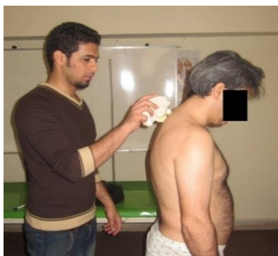
تصویر ۳: اندازه‌گیری زاویه کایفوز و لوردوز با اسپینال موس

برای اندازه‌گیری کایفوز و لوردوز از دستگاه اسپینال موس استفاده شد. این دستگاه اعتبار و روایی بالایی ( r=0/94 ) در اندازه‌گیری زوایا و انحنای بخش‌های گوناگون بدن بویژه ستون فقرات دارد. Batmenz و همکاران (۲۰۱۰)، Kolis و همکاران (۲۰۰۸) و همکاران (۲۰۰۸) Ripani و همکاران (۲۰۰۸)، Guerhazi و همکاران (۲۰۰۶)، Malion و همکاران (۲۰۰۵)، Lefring's (۲۰۰۴) و Scholes (۱۹۹۹) روایی و پایایی برای اسپینال موس در ارزیابی قوس‌های ستون فقرات و دامنه حرکتی آن گزارش کردند [۱۵، ۱۶] . وضعیت بدن در اندازه‌گیری به این شکل بود که آزمودنی در حالت آرام می‌ایستاد درحالی‌که سر رو به رو را نگاه می‌کرد، دست‌ها در کنار بدن آویزان، زانوها در اکستنشن کامل و پاها به‌اندازه عرض شانه باز بود. پس از قرار گرفتن آزمودنی در این وضعیت آزمونگر اسپینال موس را بر روی نقاط علامت زده‌شده از C7 تا S1 می‌کشید و اطلاعات دریافتی در رایانه ثبت می‌شد [۱۷] .