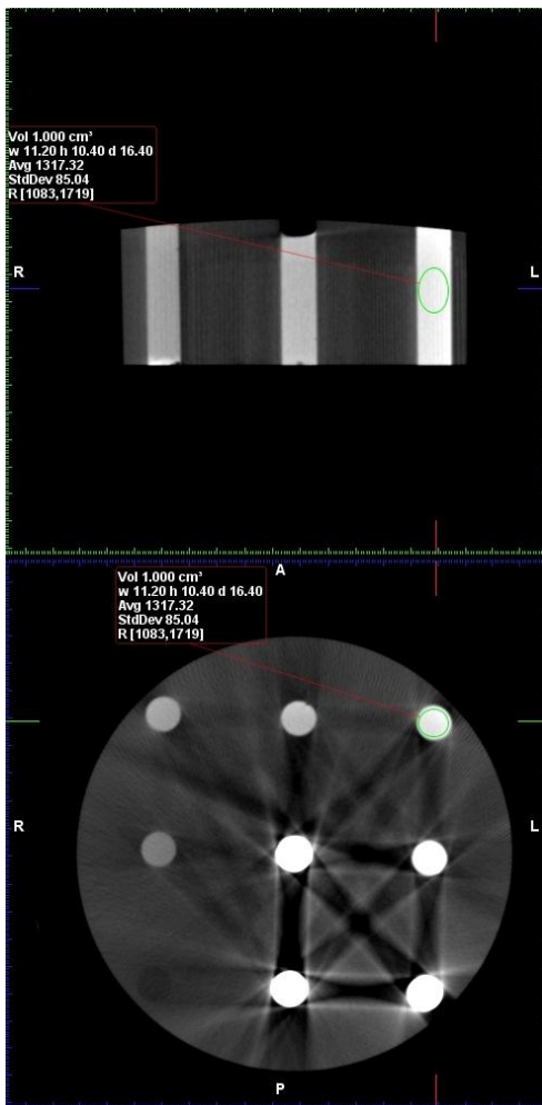
تصویر ۱: اندازه گیری voxel value حاصل از CBCT