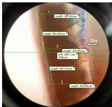
تصویر ۲: مشاهده پوسیدگی دندانی زیر میکروسکوپ پلاریزه (گروه کنترل) نقاط ۱ و ۲ و ۳، نمایانگر عمق پوسیدگی در سه ناحیه به فاصله ۵۰۰ میکرونی

منظور انجام آزمایش‌های هیستوپاتولوژی اعمال گردید. همچنین ضخامت نمونه‌ها توسط کولیس دیجیتالی اندازه‌گیری شد.