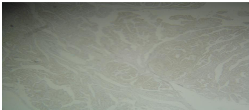
تصویر ۲: نمای میکروسکوپی بیان BAX در سلولهای تومورال (بزرگنمایی ۱۰۰)