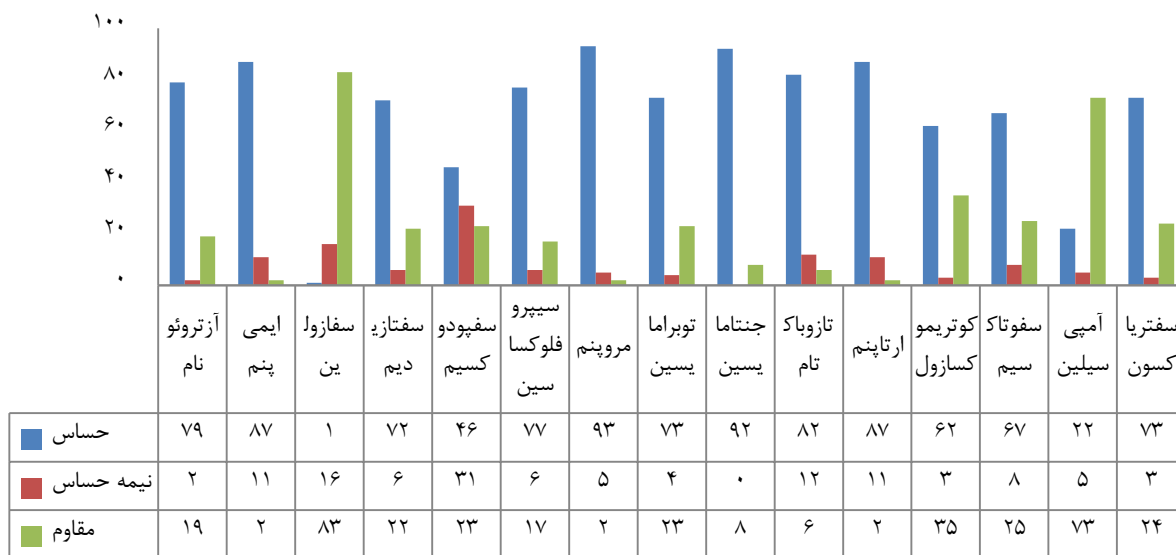
شکل ۱. فراوانی حساسیت آنتی‌بیوتیکی ۱۰۰ ایزوله سیتروباکتر

نتایج بررسی حساسیت آنتی‌بیوتیکی ایزوله‌ها در شکل ۱ نشان داده شده است. در مجموع از ۱۰۰ ایزوله سیتروباکتر جدا شده، ۷۷ مورد (۷۷/۰ درصد) به سیتروباکتر فروندی، ۱۳ مورد (۱۳/۰ درصد) به سیتروباکتر کوسری، ۹ مورد (۹/۰ درصد) به سیتروباکتر براکی (Citrobacter braakii یا C.braakii) و ۱ مورد (۱/۰ درصد) هم به سیتروباکتر یانگی (Citrobacter youngae یا C.youngae) تعلق داشت. بیشترین ایزوله‌های جدا شده به ترتیب از نمونه‌های ادرار، خون و مدفوع بود. از میان ایزوله‌ها، در ۵