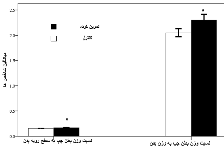
شکل ۱- نسبت وزن بطن چپ به وزن بدن و سطح رویه بدن در گروه تمرین کرده و کنترل * = معنی داری در سطح p \leq 0.03