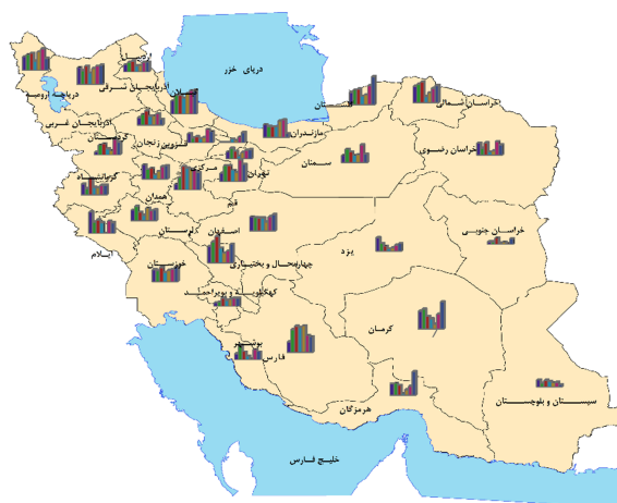
خانوارهای مواجهه یافته با مخارج کمرشکن سلامت (%)