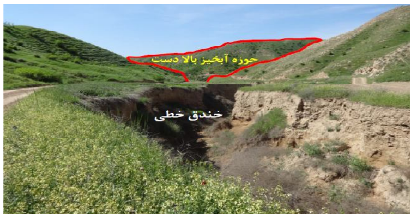
شکل 3- نمایی از یک خندق خطی و منطقه حوزه آبخیز بالا دست آن