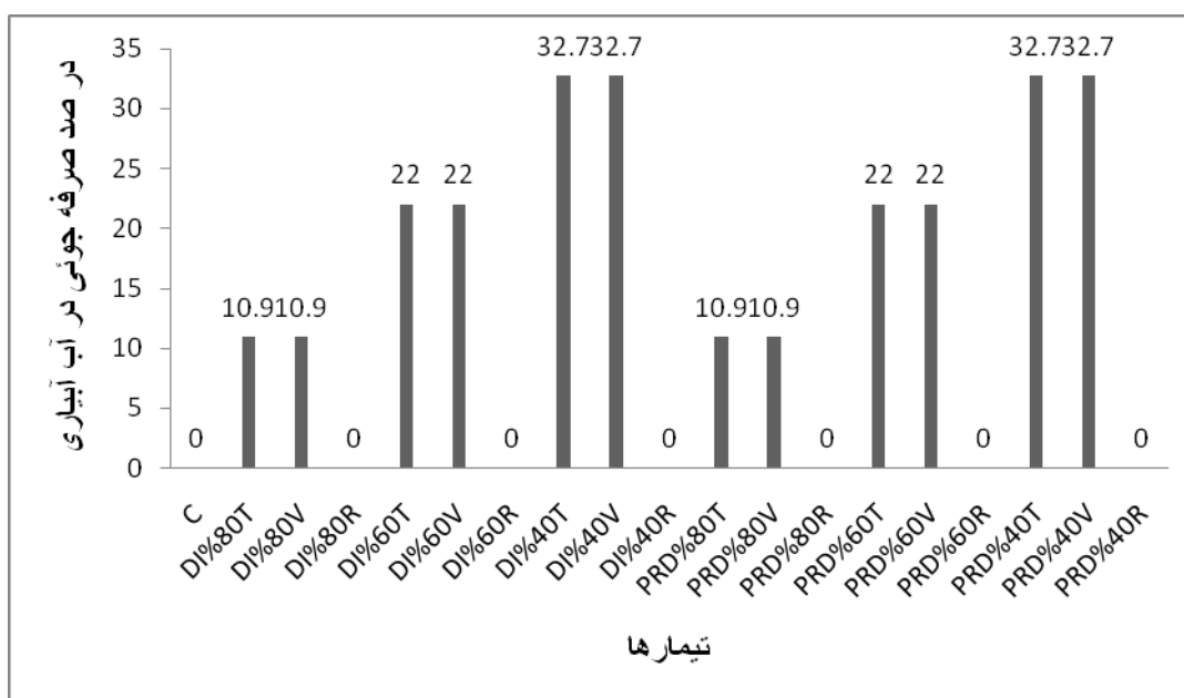
شکل ۱- درصد صرفه جوئی در آب آبیاری در تیمارهای مختلف در دوره رشد رویشی