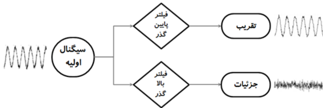
شکل ۱- تجزیه سیگنال با استفاده تبدیل موجک گسسته