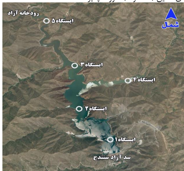
شکل ۱: نقشه ماهواره ای دریاچه سد آزاد سنندج و موقعیت جغرافیایی ایستگاههای نمونه برداری (کردستان، سال ۹۵-۱۳۹۴)

سد مخزنی آزاد سنندج در مسیر رودخانه مهم کوماسی (آزاد) ایجاد و در سال ۱۳۹۲ مورد بهره برداری قرار گرفت. این مطالعه در سال ۵-۱۳۹۴ در ۵ ایستگاه در ناحیه رودخانه ای (ایستگاه های ۴ و ۵)، انتقالی (ایستگاه ۳) و دریاچه ای (ایستگاه های ۱ و ۲) انجام شد. موقعیت جغرافیایی و نیز مشخصات هر ایستگاه در شکل ۱ و جدول ۱، آمده است. نمونه برداری بصورت ماهانه در لایه سطحی تمام ایستگاهها و نیز لایه های مختلف از ایستگاه های عمیق (۱، ۲ و ۳) صورت پذیرفت.