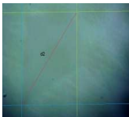
شکل ۱: روش محاسبه ریز سختی مینا در دو نقطه (یک نقطه در راست و یک نقطه در چپ)