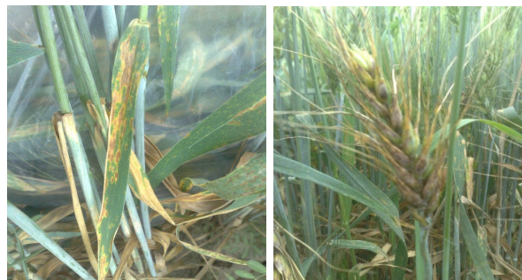
شکل ۱- علائم آلودگی خوشه و برگ‌های گندم به Phaeosphaeria

بود. حداقل ۵۰ عدد از هر یک از اندام‌های قارچی (پیکنیدیوم و پیکنیدیوسپور) در چند نمونه میکروسکوپی بررسی و اندازه‌گیری شدند (شکل ۲ و ۳). شناسایی و تعیین گونه بر اساس منابع معتبر قارچ شناسی انجام شد (Cunfer and Ueng, 1999; Shoemaker and Babcock, 1989).