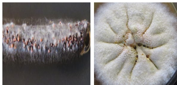
شکل ۲- به ترتیب پرگنه و پیکنیدیوسپورهای نارنجی شکل قارچ

Fig. 1. The symptom of infected ears and leaves to Phaeosphaeria nodorum in the field