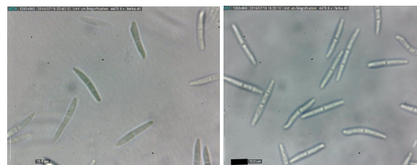
شکل ۳- نمای میکروسکوپی پیکنیدیوسپورهای قارچ

Fig. 2. Mycelium and pycnidiospores on YSA media respectively