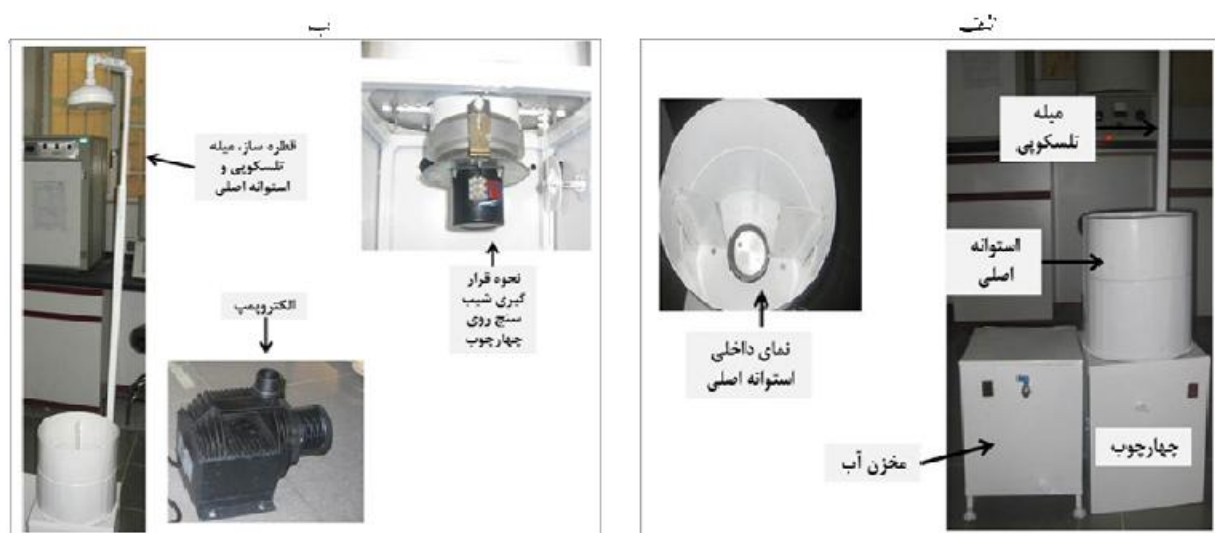
شکل ۱. دستگاه پاشمانی چندمتغیره، الف: میله تلسکوپی، چهارچوب، استوانه اصلی و نمای داخلی از نحوه قرارگیری استوانه نمونه‌گیری در داخل استوانه اصلی، ب: الکتروپمپ، قطره‌ساز میله تلسکوپی و استوانه اصلی و نحوه قرارگیری شیب‌سنج روی چهارچوب

و عامل سوم شیب با دو سطح (۵ و ۱۵ درصد) در قالب طرح کاملاً تصادفی در سه تکرار اجرا شد. محاسبات آماری نتایج به‌وسیله نرم‌افزارهای SAS 9.1 و SPSS/ver.16 صورت گرفت.