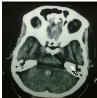
تصویر شماره ۱. سی تی اسکن از مغز بیمار

در بدو مراجعه علائم حیاتی بیمار نرمال بود و کمی از سردرد مبهم شکایت داشت. سرگیجه وی همراه با تهوع و استفراغ بود که با دراز کشیدن مختصری بهبود می یافت. در معاینه انجام شده ضعف محیطی عصب ۷ در سمت راست صورت به همراه اختلال در نگاه مشترک چشم ها به سمت راست وجود داشت. هم چنین کاهش حس سمت راست صورت در معاینه آشکار شد. در معاینه سایر اعصاب کرانیال و سیستم حسی-حرکتی-تعادلی اختلالی وجود نداشت. با توجه به دسترسی بهتر و سهولت انجام توموگرافی کامپیوتری (سی تی اسکن)، بیمار ابتدا تحت سی تی اسکن بدون تزریق مغز از نظر وجود ضایعه در ناحیه پل مغزی قرار گرفت و در سی تی اسکن ایشان یک ناحیه هایپرندس تنها در یک مقطع سی تی اسکن، در ناحیه بطن چهارم و در مجاورت پل مغزی دیده شد، اما در بقیه نواحی مغز شواهدی به نفع ضایعه مشهود نبود(تصویر شماره ۱).