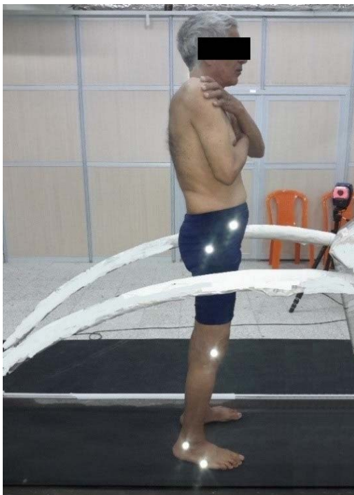
تصویر شماره ۱: محل اتصال نشانگرهای رفلکسی روی بدن

قرار گرفته و طرف راست بدن وی به سمت دوربین‌ها قرار دارد، روی نوار گردان بایستد. پس از اینکه هر آزمودنی به حالت ثبات در محل انجام آزمایش رسید، اعمال اغتشاش به وسیله حرکت کردن ناگهانی دستگاه نوار گردان صورت گرفت. در حقیقت، بدون دادن آگاهی به آزمودنی، نوار گردان شروع به حرکت کرد و اغتشاش در جهت قدامی- خلفی به قامت فرد اعمال شد. سرعت حرکت اولیه نوار گردان براساس طرح پایلوت برای همه آزمودنی‌ها 1/1 \text{ m/s} تنظیم شده بود که موجب جابه‌جایی 40 سانتی‌متری نوار گردان شد. گفتنی است که طرح پایلوت مذکور در قالب همین تحقیق و توسط همین پژوهشگران صورت گرفت که طی آن، سرعت‌های گوناگون حرکت نوار گردان برای رسیدن به یک اغتشاش مطلوب، مورد آزمون و خطا قرار گرفتند.