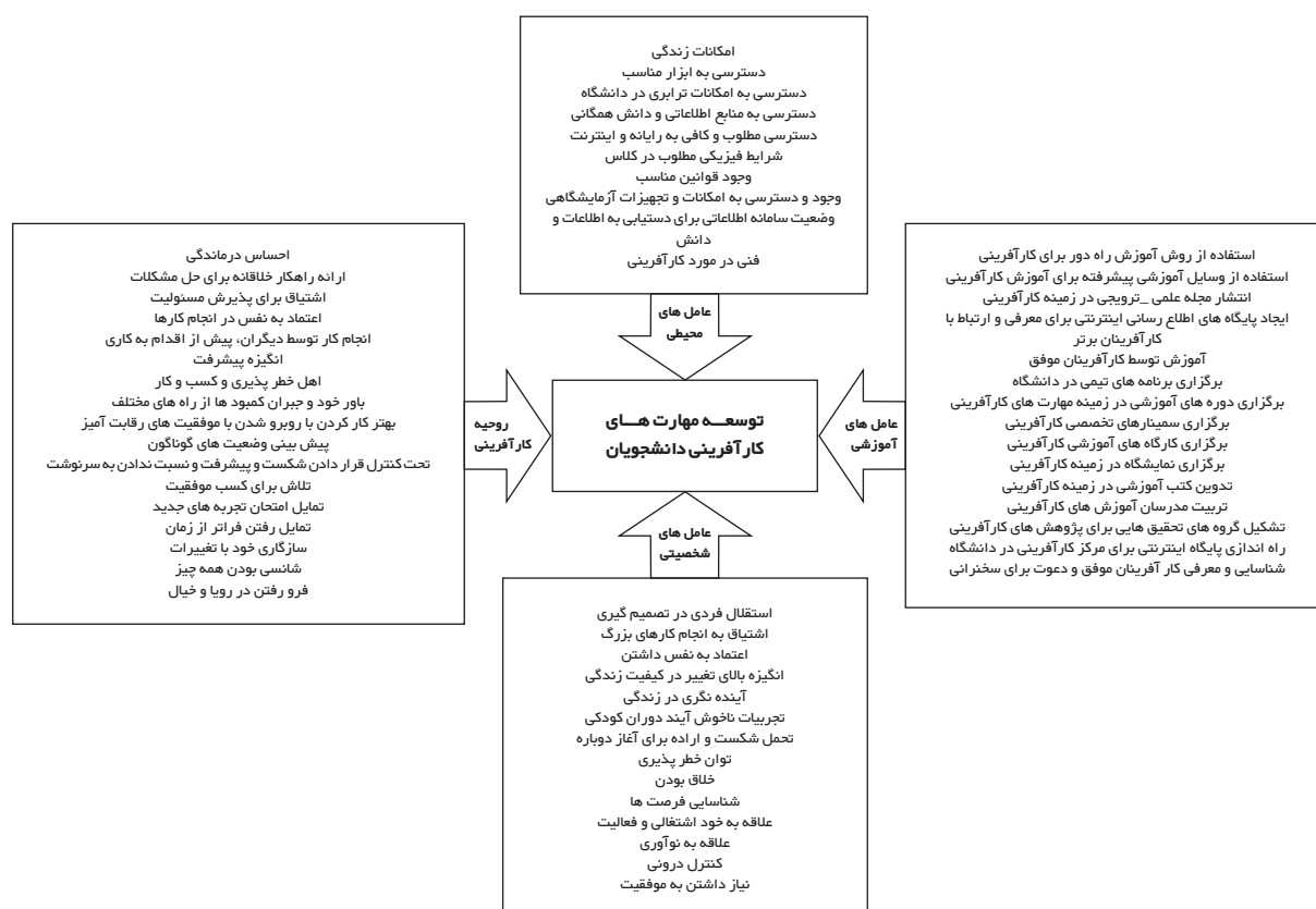
نگاره ۱- مدل نظری عامل های موثر بر توسعه ی مهارت های کار آفرینی دانشجویان آموزش شده های کشاورزی

اما، بررسی توسعه روحیه و مهارت های کار آفرینی در دانشجویان یکی از جنبه های ارزیابی کیفیت فعالیت های آموزشی عالی می باشد. این تغییر در تحلیل کارایی درونی نظام آموزش عالی به منظور پی بردن به وضع موجود و آسانی تصمیم گیری مورد استفاده قرار می گیرد که با استفاده از نتیجه ی آن می توان از طریق برنامه ریزی آموزشی در جهت بهبود فعالیت ها کوشش کرد. تخصص دانشگاهی در قالب اشتغال، هنگامی صورت واقعی و عملیاتی به خود می گیرد که شکل گیری روحیه و مهارت های کار آفرینی در دانش آموختگان آموزش عالی در دوران