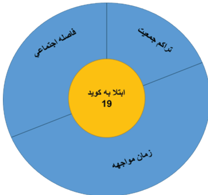
نمودار ۲: نمودار عوامل موثر بر سرایت کووید ۱۹

همانطور که مشاهده می‌شود ناسازگاری پاسخ‌ها، ۰/۰۰۸۷۷ است که از ۰/۱۰ کمتر و قابل قبول می‌باشد. لذا این وزن‌ها پس از رند شدن مبنای محاسبه تاثیر هر عامل در خطرپذیری قرار گرفته است: