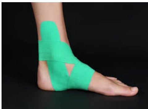
شکل ۳. نحوه انجام تیبینگ تمرینات قدرتی-تعادلی

پروتکل تمرینی مورد استفاده در جدول شماره ۱ گزارش شده است.