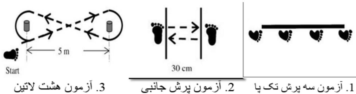
شکل ۲. آزمون‌های عملکردی پرش جانبی، آزمون هشت لاتین و سه لی تک پا