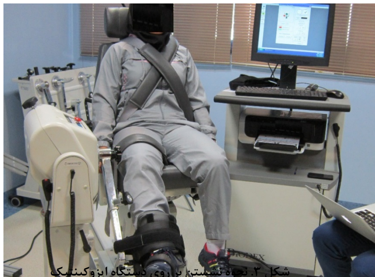
شکل ۳. نحوه نشستن بر روی دستگاه ایزو کینتیک

*مفصل هیپ در زاویه تقریباً ۱۰۰ درجه تنظیم شد و تنه و ران با بلت‌های ویژه به صندلی بسته و محکم شد. ساق پا با استفاده از تسمه‌ای ویژه در پوزیشن حداکثر چرخش خارجی قابل تحمل آزمودنی قرار گرفت.