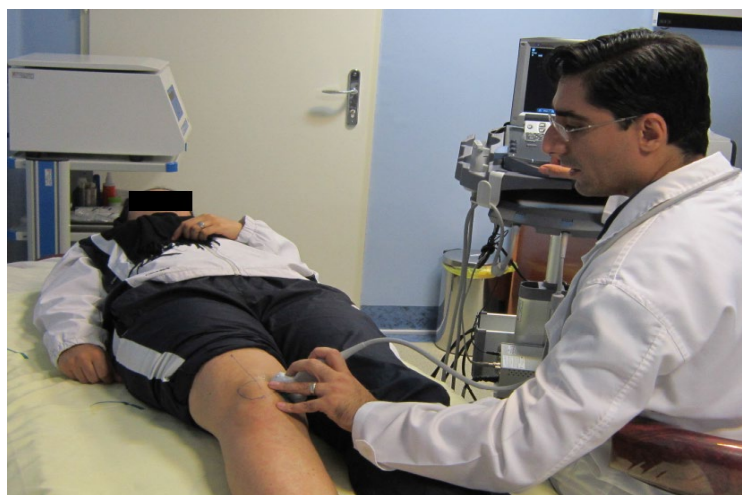
شکل ۱. پوزیشن آزمودنی و روش تصویربرداری سونوگرافی

پژوهش حاضر از نوع پژوهش‌های نیمه‌تجربی و به لحاظ هدف از نوع پژوهش‌های کاربردی است. جامعه آماری پژوهش را کلیه زنان مبتلا به سندروم فشار خارجی پاتلوفمورال تشکیل داده‌اند. نمونه‌های تحقیق به روش در دسترس از بین مراجعه‌کنندگان شهر تهران به کلینیک‌های ارتوپدی و فیزیوتراپی که شرایط ورود به مطالعه را داشته و حاضر به شرکت در مطالعه بودند، انتخاب شدند. ۳۰ نفر از این بیماران به طور تصادفی به یکی از ۲ گروه تجربی (۱۵ نفر) و کنترل (۱۵ نفر) اختصاص داده شدند. از بین آزمودنی‌ها، ۲۴ نفر راست‌پا و ۶ نفر چپ‌پا بودند. معیارهای ورود آزمودنی‌ها به تحقیق ۱۲ عبارت بودند از احساس درد در اطراف مفصل پاتلوفمورال به‌ویژه کناره خارجی آن در حداقل دو مورد از فعالیت‌های نشستن طولانی‌مدت، بالا رفتن از پله‌ها، اسکات، دویدن، دو زانو نشستن و لی‌لی کردن، مثبت بودن جواب تست کلارک، مثبت بودن جواب تست عملکردی زانو، مثبت بودن جواب تست فشار پاتلا، مثبت بودن جواب تست وحشت پاتلا، وجود علائم سندروم فشار خارجی پاتلوفمورال در طول مدتی بیش از ۶ ماه و محدوده سنی ۱۸ تا ۳۰ سال. معیارهای خروج از پژوهش ۱۱ حاضر عبارت بودند از وجود هر گونه آسیب‌های منیسکی یا لیگامنتی زانو، آرتروز زانو، سابقه دررفتگی شدید پاتلا، سابقه قفل‌شدگی زانو، سابقه فیزیوتراپی یا جراحی زانو، وجود اختلالات نورولوژیکی مانند نقص در سیستم دهلیزی، باردار بودن آزمودنی‌ها،