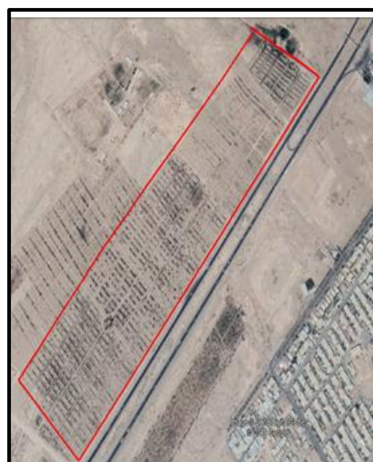
شکل ۱. موقعیت منطقه تحقیق