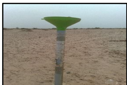
شکل ۳. تله‌های رسوبگیر ساخته‌شده