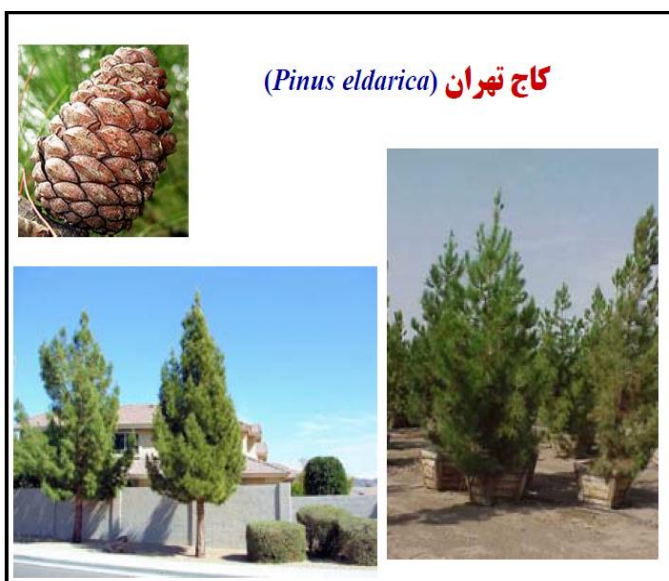
شکل ۲. درخت کاج تهران