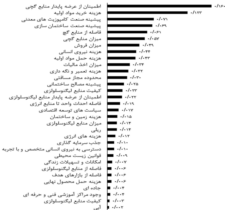
شکل ۲. میانگین هندسی ماتریس‌های مقایسه‌ای برای شاخص‌های اصلی نسبت به هدف مطالعه (سطح اول)