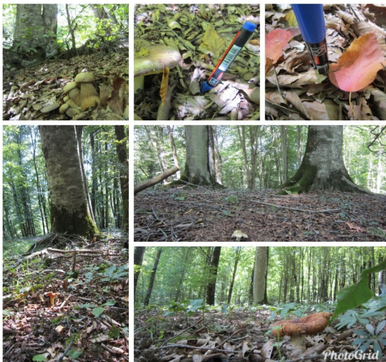
شکل ۱. منطقه تحقیق در جنگل سنگده

نمک‌های محلول در خاک و ناشی از شرایط سنگ بستر یا آزادسازی عناصر غذایی است آزمایش شد که به حضور و نبود قارچ‌ها بستگی دارند.