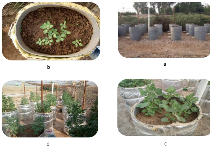
Fig4- Lysimeters layout(a), Early growth stage of the plant(b), The middle development stage of the plant(c), The final growth stage(d).

بررسی نتایج تجزیه واریانس صفات اندازه گیری شده در آزمایش نشان داد اثر آبیاری با زه آب بر شاخص های عملکرد دانه، عملکرد بیولوژیکی، شاخص برداشت، ارتفاع گیاه و وزن هزار دانه در سطح احتمال یک درصد معنی دار بود (جدول ۳). این نتایج با نتایج بسیاری