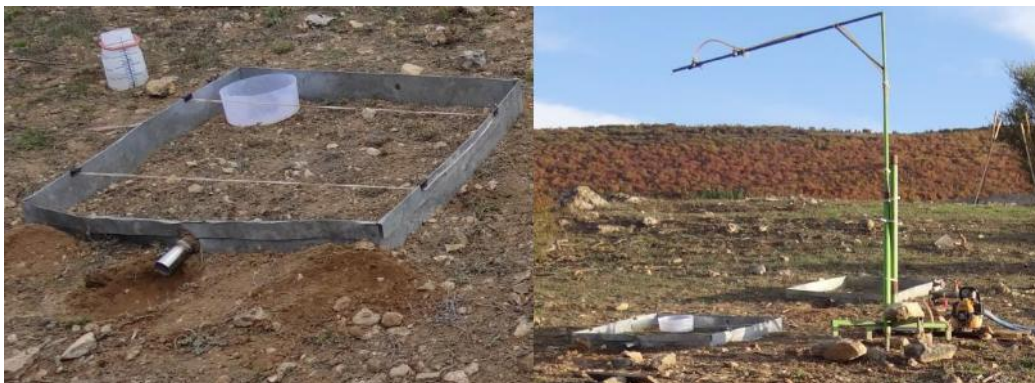
شکل ۲- شبیه‌ساز باران (راست) و کرت صحرایی (چپ) مورد استفاده در این پژوهش Figure 2. Rainfall simulator (right) and field plot (left) used in this research