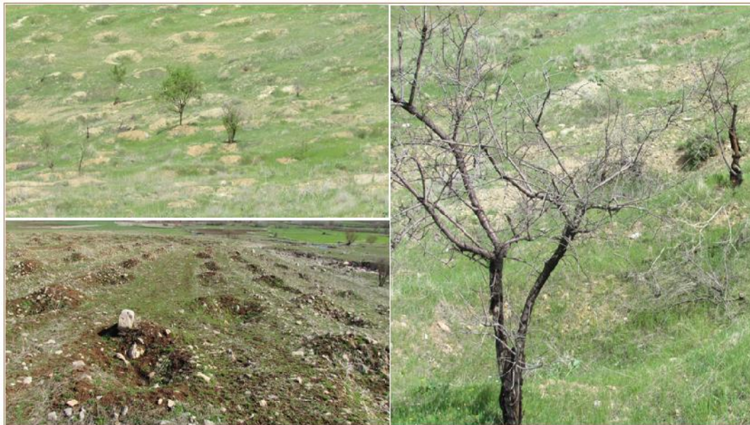
شکل ۲- باغات دیم و وضع موجود چاله‌ها و پایه‌های خشکیده Figure 2. Rain-fed orchards; pits and dried seedlings

اوج، تاخیر در سیل، زمان پایه سیل و حجم سیلاب ایجاد نکرد.