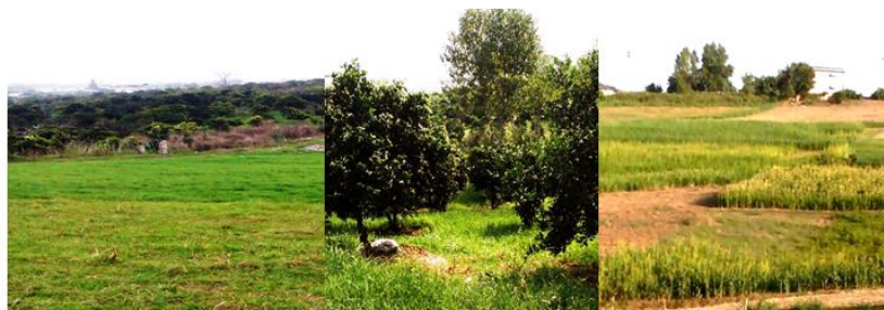
شکل ۲- نوع کاربری‌های مورد مطالعه (از چپ به راست: مرتع، باغ، زراعی) Figure 2. Pictures showing examples of the three land uses. From left to right: rangeland, orchard and agricultural

آزمایشگاه منتقل گردید و پس از هواخشک شدن و کوبیدن، از الک ۲ میلی‌متری عبور داده شدند. بافت خاک به روش هیدرومتر (۱۰)، جرم مخصوص ظاهری خاک به روش سیلندر (۴)، جرم مخصوص حقیقی به روش پیکنومتر (۵)، تخلخل خاک به صورت محاسباتی با استفاده از جرم مخصوص ظاهری و حقیقی طبق فرمول زیر اندازه‌گیری شد (۱۶).