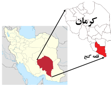
شکل ۲- موقعیت مکانی روستاهای مورد مطالعه Figure 2. Location of case study area

اجتماعی، همکاری نهادی، و پایداری زیستی که برای هر کدام از این مولفه‌ها، شش گویه (کلا ۳۰ گویه، به جزء سوالات مربوط به ویژگی‌های فردی) در نظر گرفته شدند. پرسشنامه‌های تکمیل شده، پس از بازبینی و بررسی دقت و صحت داده‌ها، مورد پردازش، تجزیه و تحلیل آماری قرار گرفتند. در بخش آمار توصیفی متغیرها، از آماره‌هایی همچون میانگین، میانه، مُد، انحراف معیار، بیشینه، و کمینه، و برای مقایسه میانگین‌های پارامترها از آزمون‌های همبستگی پیرسون، لوین، تی‌تست، رگرسیون، F، دوربین-واتسون و