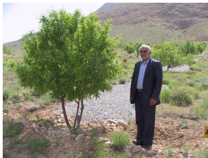
شکل ۵- رشد و نمو درختان بادام دیم تحت شرایط تیمار پلاستیک و سنگریزه (۲۴)

به منظور مدل نمودن میزان عمق رواناب استحصالی از سطوح آبیگر با تیمارهای به کار برده شده در شرایط اقلیمی نیمه‌خشک، میانگین ضریب رواناب در تیمارهای مختلف محاسبه شد. ضریب رواناب یکی از معیارهایی است که ویژگی نفوذپذیری یک سطح را در مقابل بارندگی نشان می‌دهد. نتایج پژوهش حاضر نشان داد که میانگین ضریب رواناب در تیمارهای شاهد (زمین دست نخورده) و جمع‌آوری پوشش سطحی در طی بارش‌های مورد بررسی، به ترتیب 1/8 و 7/7 درصد محاسبه شده است. این امر حکایت از آن دارد که پوشش گیاهی و خار و خاشاک موجود در سطح سامانه آبیگر دارای نقش قابل توجه در کاهش ضریب رواناب داشته و تنها حذف آن از سطح سامانه، ضریب رواناب را 4 برابر افزایش داده است. این مزیتی است که تیمار جمع‌آوری پوشش سطحی به دلیل تمیز کردن همه ساله سطح پلات از گیاهان و افزایش ضریب رواناب نسبت به تیمار طبیعی به دست آورده است. تحقیقات هادی‌قورقی و اوسطی (۱۱) نیز در ارتباط با