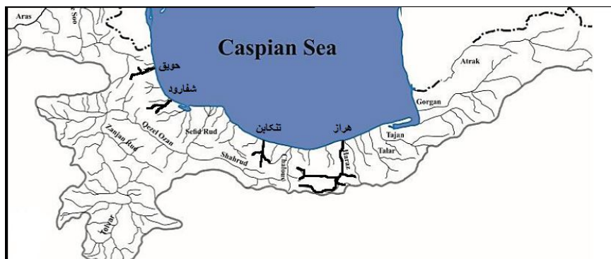
شکل ۱- موقعیت تقریبی رودخانه‌های مورد مطالعه بررسی اولویت غذایی ماهی قزل‌آلای خال قرمز ( Salmo trutta ) در بخش جنوبی دریای خزر (نگارندگان)

بررسی اولویت غذایی ماهی قزل‌آلای خال قرمز Salmo trutta Linnaeus, 1758..