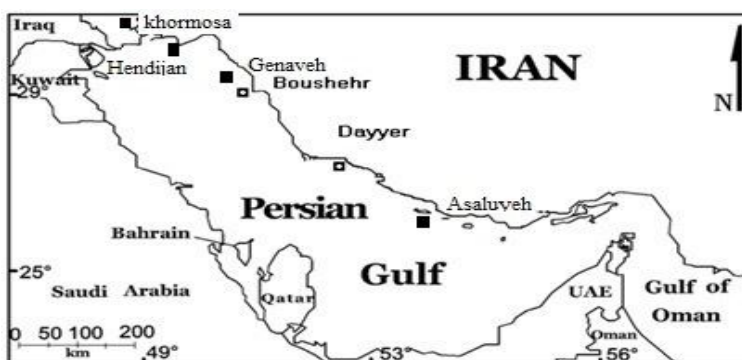
شکل ۱- موقعیت مناطق نمونه‌برداری شده از ماهی شانک زردباله ( A. latus ) در آب‌های ایرانی خلیج فارس

از ۱۲۰ عدد ماهی شانک زردباله صیدشده توسط قایق‌های صیادی صیدگاه‌های بندر دیر و عسلویه (۳۰ نمونه)، بندر بوشهر (۳۰ نمونه)، گناوه (۳۰)، هندیجان (۳۰) و خورموسی (۳۰ نمونه) از زمستان ۸۹ تا بهار ۱۳۹۰ نمونه‌برداری شد (شکل ۱). از هر ماهی به میزان دو تا سه گرم از بافت نرم باله دمی در الکل ۹۰ درصد تثبیت گردید.