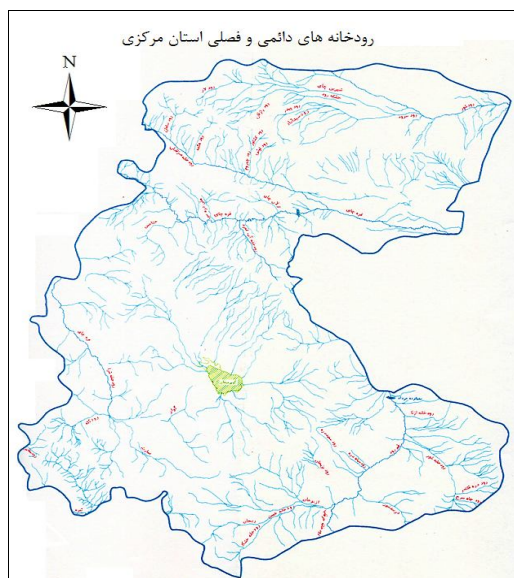
شکل ۲- موقعیت جغرافیایی رودخانه‌های دائمی و فصلی در استان مرکزی

محیط زیست و مناطق تحت مدیریت حفاظت محیط زیست استان: در استان مرکزی ۳۳۵ گونه جانوری شامل ۲۰۵ گونه پرنده، ۵۳ گونه پستاندار، ۵۴ گونه خزنده، ۴ گونه دوزیست و ۱۹ گونه ماهی بومی وجود دارد. جدول ۶ مشخصات و محدوده پراکنش ماهیان بومی در استان مرکزی را نشان می‌دهد. در بین گونه‌های ذکر شده، جمعیت گونه‌های Barbus lacerta , Alburnoides eichwaldii