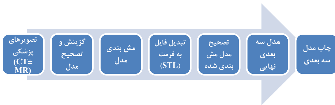
شکل ۱- فرآیند ایجاد یک مدل فیزیکی سه بعدی با استفاده از فناوری چاپ سه بعدی براساس داده‌های تصویربرداری پزشکی