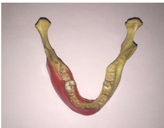
شکل ۱- تصویر مندیبل و دو لایه موم برای بازسازی تنه مندیبل

معیارهای ورود در این مطالعه شامل دندان تک ریشه انسانی کشیده شده سالم با پرکردگی گوتا پرکا در دسترس و بدون شکستگی ریشه بودند. انتخاب نمونه‌ها، بدون توجه به سن، جنس و دلیل Extraction صورت گرفت. تمامی نمونه‌ها برای تهیه تصاویر CBCT و رادیوگرافی PA دیجیتال توسط فردی که جز مشاهده‌گران نبود از شماره ۱ تا ۶۰ به صورت تصادفی کدگذاری شد و هیچ یک از مشاهده‌گران از ترتیب کدگذاری اطلاعی نداشتند. سپس در ریشه نیمی از نمونه‌ها شامل ۳۰ دندان، به صورت تصادفی با استفاده از چیزل و چکش شکستگی باکولینگوالی ایجاد شد که در ادامه با چسب دو قطعه شکسته شده بهم متصل گردید. برای تهیه تصاویر، هر دندان در محل خود بر روی جایگاه خود در مندیبل انسانی قرار گرفت. مزیت استفاده از مندیبل انسانی برای تهیه تصاویر این است که به دلیل سوپرایمپوز شدن استخوان بر روی ریشه دندان تصاویر به دست آمده طبیعی‌تر و مشابه مدل انسانی است. برای بازسازی بافت نرم روی تنه مندیبل از ۲ لایه موم استفاده گردید (شکل ۱).