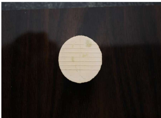
شکل ۲- نمونه گچی زیر دوربین از فاصله ۱۵ سانتی متری

برای اندازه‌گیری میزان ثبت جزئیات شیار ۵۰ میکرومتری با میکروسکوپ نوری با بزرگنمایی ۱۲ برابر مشاهده شده و هر نمونه در یکی از گروه‌های زیر قرار گرفت: