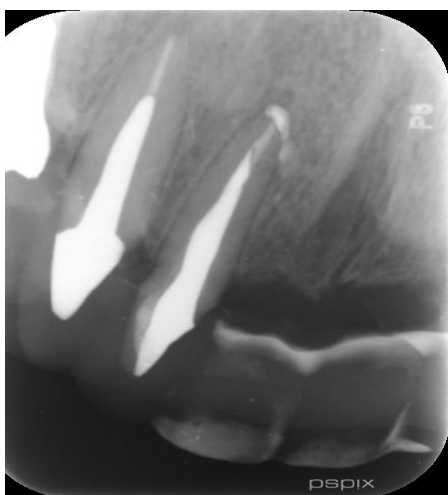
شکل ۸- فالوآپ ۱۲ ماهه

داروی داخل کانال خارج شد و کانال‌ها با ۵ میلی لیتر ۱۷٪ EDTA (Morvabon, Iran) به مدت ۱ دقیقه و سپس ۵ میلی لیتر ۲.۵٪ NaOCl به مدت ۱ دقیقه برای برداشت اسمیرلیبر شستشو داده شد. سپس کانال‌های ریشه با کن‌های کاغذی استریل خشک شد و کانال‌ها با گوتاپرکا و سیلر Endoseal MTA پر شدند. تیپ پلاستیکی تا رسیدن به طول وارد کانال شد و سپس سیلر به درون کانال تزریق شد و یک کن اصلی (master cone) (۶٪، #40) آغشته با Endoseal MTA داخل کانال تا طول کارکرد قرار داده شد و کانال به روش single cone پر شد. پس از پرکردن کانال گوتاپرکای اضافی به کمک وسایل داغ دستی خارج شد. در انتها پالپ چمبر با الکل اتیلیک ۷۰٪ تمیز و دندان با ماده ترمیم موقت پر شد. رادیوگرافی پس از پرکردگی کانال ریشه دندان، پر شدن کامل سیستم کانال ریشه را نشان داد، اما میزان کمی اکستروژن Endoseal MTA در سطح جانبی ریشه وجود داشت (شکل ۵).