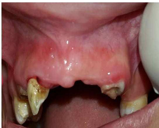
شکل ۴- بهبود سینوس ترکت

پس از تهیه رضایت نامه شفاهی و کتبی از بیمار، پیش از شروع درمان کانال ریشه، بیمار از تشخیص و طرح درمان مطلع شد. سپس بی حسی موضعی لیدوکائین ۲٪ با اپی نفرین ۱/۸۰۰۰۰ تزریق شد و دندان ۱۲ با رابردم ایزوله و حفره دسترسی با هندپیس با سرعت بالا تحت اسپری آب و هوا تهیه شد. کانال‌ها با 2.5% NaOCl (Diluted chloraxid 5.25% cerkamed, medicalcompany, Poland) شستشو داده شد و طول کارکرد دندان با اپکس لوکیتور (Meta biomed, southkorea) I root اندازه‌گیری و با رادیوگرافی تأیید شد. آماده سازی بیومکانیکال کانال‌ها با فایل روتاری نیکل تیتانیوم Protaper (Dentsply, mailifer) به روش crown down تا فایل F4