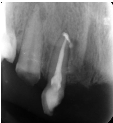
شکل ۶- فالوآپ ۳ ماهه