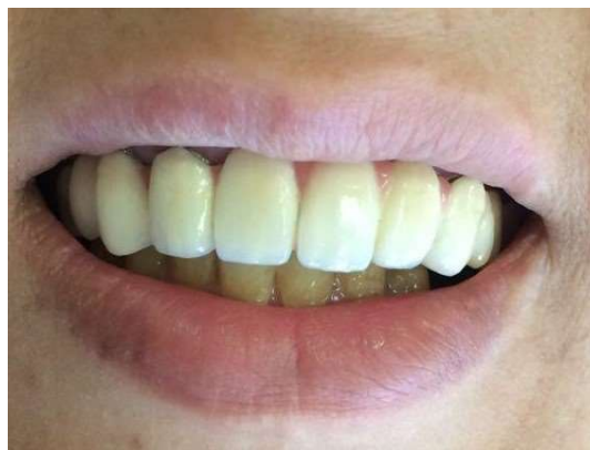
شکل ۹- پس از درمان پروتز

MTA ماده ترمیم کننده مناسبی است که در درمان‌های اندودنتیک به صورت گسترده‌ای مورد استفاده قرار می‌گیرد، این ماده دارای ویژگی‌های مناسب بسیاری می‌باشد که از جمله آن‌ها به زیست سازگاری بالا، سیل مناسب و فعالیت ضدباکتریایی آن می‌توان اشاره کرد (۱۷، ۱۶).