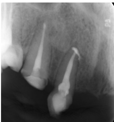
شکل ۷- فالوآپ ۶ ماهه