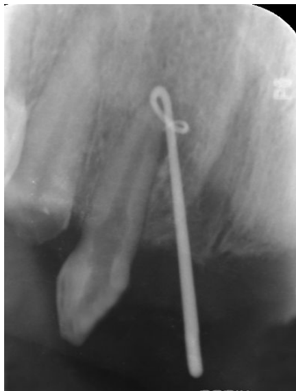
شکل ۲- trace کردن سینوس ترکت