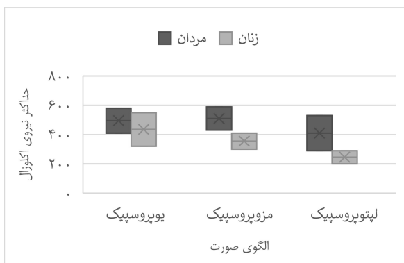
نمودار ۲- حداکثر نیروی اکلوزال و جنس و الگوی صورت

بر طبق آنالیز آماری رابطه معنی‌داری بین حداکثر نیروی اکلوزال و هیچ یک از فرم‌های سه گانه سر وجود نداشت ( P=0/813 ). طبق تست correlation بین الگوی سر و صورت رابطه معنی‌داری وجود نداشت ( P=0/523 ). حداکثر نیروی اکلوزال در مردان همواره بیشتر از زنان بود و این بیشتر بودن در هر یک از الگوهای صورتی نیز برقرار بود. به طور مثال در مردان یوپروسپیک میزان MOF از زنان یوپروسپیک بیشتر بود و این بیشتر بودن در هر یک از فرم‌ها به یک نسبت در مردان از زنان بود به همین دلیل از لحاظ آماری معنی‌دار نبود (نمودار ۲).