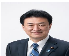
کی‌هارا مینوری ۱ وزیر دفاع