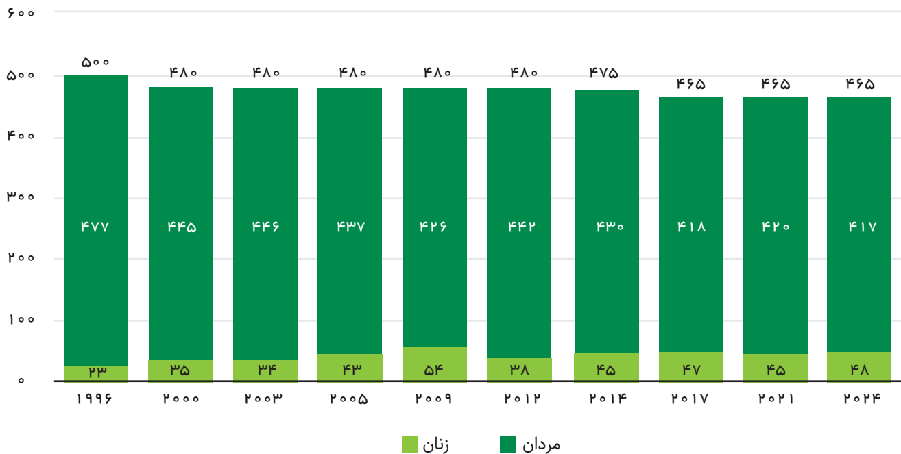
شکل ۱. نمودار تعداد قانونگذاران مجلس نمایندگان

نامزدهایی که بیشترین رأی را بیاورند می‌توانند متصدی مقام نمایندگی در مجلس نمایندگان باشند. طول مدت هر دوره این مجلس ۴ سال است، در حالی که دولت می‌تواند هر زمانی آن را منحل کند و خواستار انتخابات جدید شود.