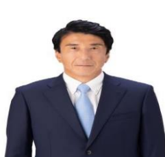
سائیتو کین ۹ وزیر اقتصاد، تجارت و صنعت