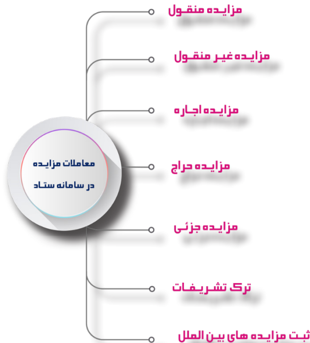
شکل ۲. انواع معاملات در سامانه مزایده ستاد