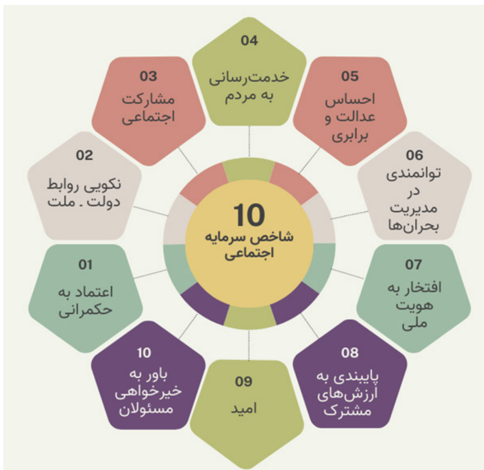
شکل ۱. شاخص‌های سرمایه اجتماعی