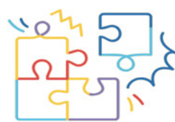
شکل ۲. تحلیل وضعیت سرمایه اجتماعی در سال ۱۴۰۱

خاص‌ترین موضوع اثرگذار بر سرمایه اجتماعی: مدیریت اغتشاش‌ها و ناآرامی‌ها