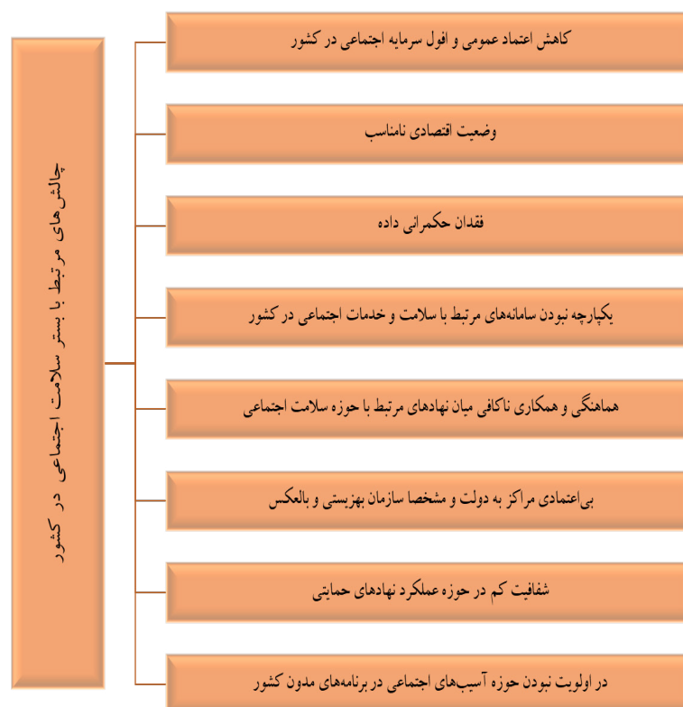
شکل ۱. آسیب‌ها و نقاط ضعف مرتبط با مراکز در بستر سلامت اجتماعی

مراکز به‌مانند سایر نهادهای حمایتی در حوزه عملکردی خود شفافیت مناسبی ندارند. به‌عبارت‌دیگر مددجو، مردم و نهادهای مردمی، امکان مشاهده و ارزیابی کمی و کیفی عملکردی و انضباط مالی مراکز و سازمان را ندارند. گزارش‌های مالی در سامانه‌های آنها مشاهده نمی‌شود. بسیاری از مراکز بستر سامانه‌ای شفافیت ندارند و صرفاً اطلاعات عملکردی خود را به‌صورت کاملاً حفاظت‌شده در اختیار سازمان بهزیستی قرار می‌دهند. سازمان بهزیستی نیز که گزارش‌های عملکردی و مالی خود را در معرض دید مردم، شرکای اجتماعی و خدمت‌گیرندگان خود قرار نمی‌دهد. رویکردی که