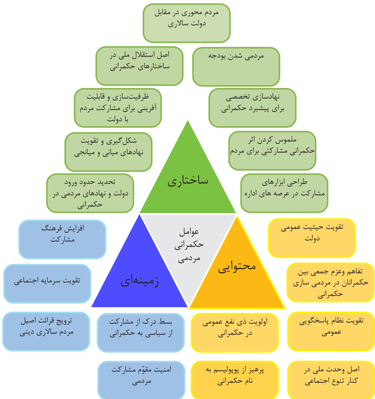
شکل ۲. عوامل مؤثر بر حکمرانی مردمی

عواملی که در جهت مردمی شدن حکمرانی مطرح هستند، را می‌توان در سه دسته زمینه‌ای، محتوایی و ساختاری طبقه‌بندی کرد.