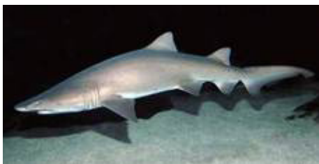
ببر کوسه شنی ( Carcharias taurus )