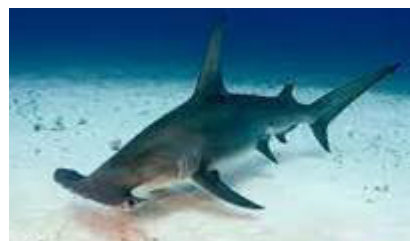
کوسه سرچکشی بزرگ ( Sphyrna mokarran )