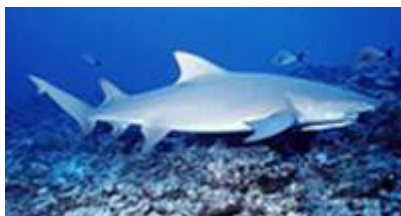
کوسه لیمویی ( Negaprion acutidens )