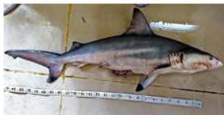
کوسه پوندی چری ( Carcharhinus hemiodon )