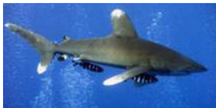
کوسه باله سفید اقیانوسی ( Carcharhinus longimanus )