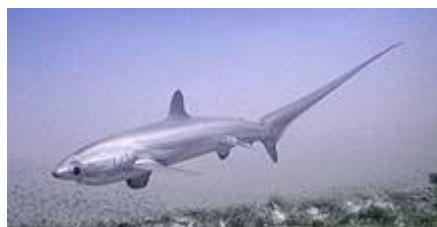
کوسه دراز پلاژیک ( Alopias pelagicus )