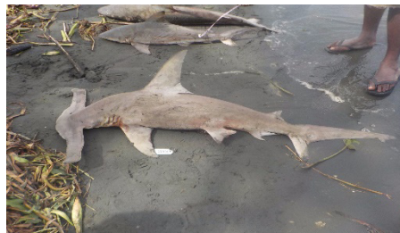
کوسه سر چکشی سر پهن ( Eusphyra blochii )