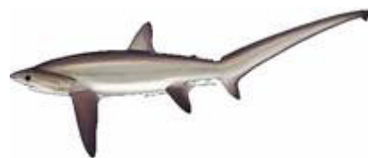
کوسه دم دراز چشم درشت ( Alopias superciliosus )