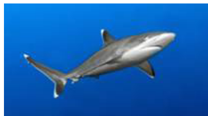
کوسه نوک باله نقره ای ( Carcharhinus albimarginatus )