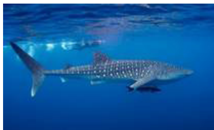
کوسه نهنگ ( Rhincodon typus )