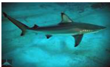
کوسه دندان صاف باله سیاه ( Carcharhinus leiodon )