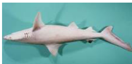
کوسه چانه سفید ( Carcharhinus dussumieri )