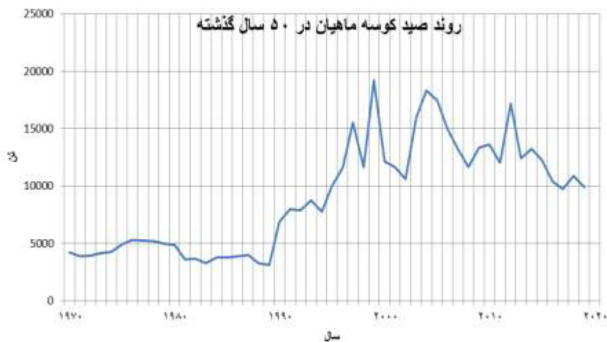
نمودار ۱. روند صید کوسه ماهیان در آب های جنوبی ایران و میزان صید کوسه ماهیان در پنج دهه گذشته

اگرچه میزان صید کوسه ماهیان تنها یک درصد از کل صید آبزیان کشور ما را شامل می شود لکن از آنجایی که کوسه ماهیان جزو ماهیان غضروفی هستند و از رشد کند و زادآوری پایینی برخوردارند همین موضوع بسیار حائز اهمیت بوده و با مقایسه این روند در پنج دهه گذشته (نمودار ۱) می توان دریافت که تلاش صید برای بهره برداری از کوسه ماهیان افزایش یافته است. اگرچه این روند در سال های پایانی دهه گذشته به خاطر جریمه های سنگین وضع شده از سوی شورای عالی حفاظت محیط زیست کشور روبه کاهش گذاشته است.