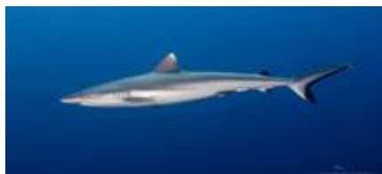
کوسه خاکستری مرجانی ( Carcharhinus amblyrhynchos )