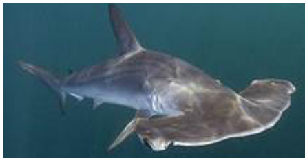
کوسه سرچکشی سر صاف ( Sphyrna zygaena )