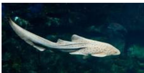
کوسه گورخری ( Stegastoma fasciatum )