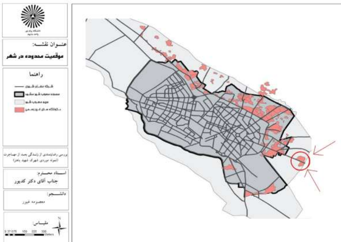
نقشه (۱): موقعیت محدوده در شهر

شهرک شهید باهنر (قلعه خیابان) از ۵ محله عرفی شکل گرفته که این محلات اکثراً از لحاظ قومیتی و مذهبی با هم دیگر تفاوت دارند. ۱- محله قلعه خیابان قدیمی ترین محله شهرک که در بخش شمالی شهرک واقع است و خیابان امام خمینی فعلی از میان آن می گذرد. ۲- محله تاجر آباد در شمال غربی محله واقع است. ۳- محله عیش آباد این محله هم از محلات قدیمی شهرک می باشد که در شمالی ترین قسمت این شهرک واقع است. ۴- محله ظفری این محله ما بین محله عیش آباد و تاجر آباد در بخش مرکزی شمال شهرک واقع است. ۵- محله چلو یا طالقانی که در جنوب شهرک واقع است و نسبت به محلات دیگر از قدمت کمتری برخوردار می باشد.