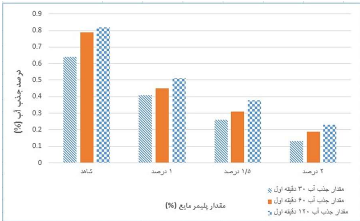
شکل شماره (۴): نمودار آزمون جذب آب در نمونه‌های دارای پلیمر مایع

هر دو بخش خمیره سیمان و سنگدانه‌ها دارای منافذی هستند و در نتیجه بتن ساخته شده نیز دارای این حفرات بوده که در اثر عدم تراکم کامل آن و یا آب انداختن بتن می‌باشد. این منافذ در بتن حجمی در حدود ۱ تا ۱۰ درصد حجم بتن را تشکیل می‌دهند که به حد بالای ۱۰ درصد اصطلاحاً بتن کرمو اطلاق می‌شود. نکته قابل توجه این است که از آنجا که حفرات سنگدانه‌ها توسط خمیره سیمان پر می‌شود نتیجه می‌گیریم که میزان منافذ بتن به طور زیادی تحت تاثیر منافذ و حفرات موجود در خمیره سیمان است.