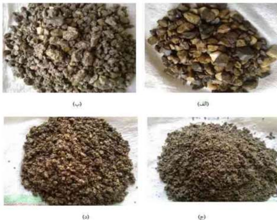
شکل شماره (۲): (الف) شن طبیعی، (ب) شن بازیافتی تهیه شده از بیرون، (ج) ماسه بازیافتی تهیه شده از بیرون (د) ماسه طبیعی