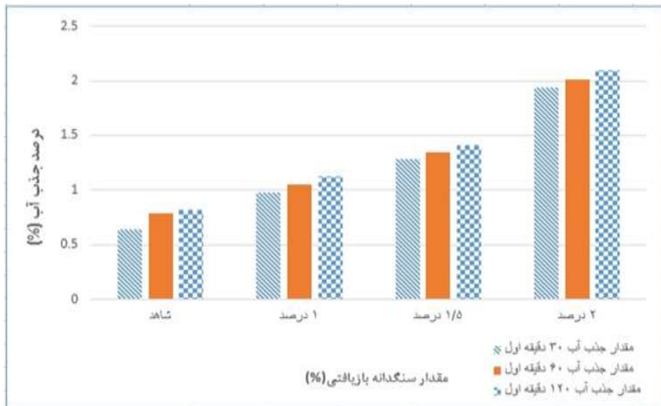
شکل شماره (۳): نمودار آزمون جذب آب در نمونه‌های دارای سنگدانه بازیافتی

بر اساس نتایج به دست آمده برای ویژگی‌های فیزیکی سنگدانه بازیافتی می‌توان نتیجه گرفت که وجود لایه‌ای از ملات هیدراته شده قدیمی در اطراف سنگدانه بازیافتی باعث می‌شود تا ویژگی‌های فیزیکی این سنگدانه در مقایسه با مصالح طبیعی از کاهش چشمگیری برخوردار باشد، که با کوچکتر شدن اندازه ذرات سنگدانه بازیافتی این کاهش بیشتر می‌گردد. با توجه به نتایج آزمون جذب آب مشاهده می‌شود که با افزایش مقدار سنگدانه بازیافتی از ۳۰ درصد به ۵۰ درصد، جذب آب نمونه‌های حاوی سنگدانه بازیافتی رفته رفته بیشتر می‌شود. به طوری که در نمونه حاوی ۵۰ درصد سنگدانه بازیافتی، مقدار ملات هیدراته شده قدیمی در اطراف درشت دانه های بازیافتی افزایش می‌یابد و همین موضوع منجر به افزایش جذب آب بتن می‌گردد. همچنین زمان ماندگاری نمونه در آب جهت توزین، با افزایش از ۳۰ دقیقه الی ۱۲۰ دقیقه، شاهد افزایش میزان جذب آب به اندازه کم می‌باشیم.