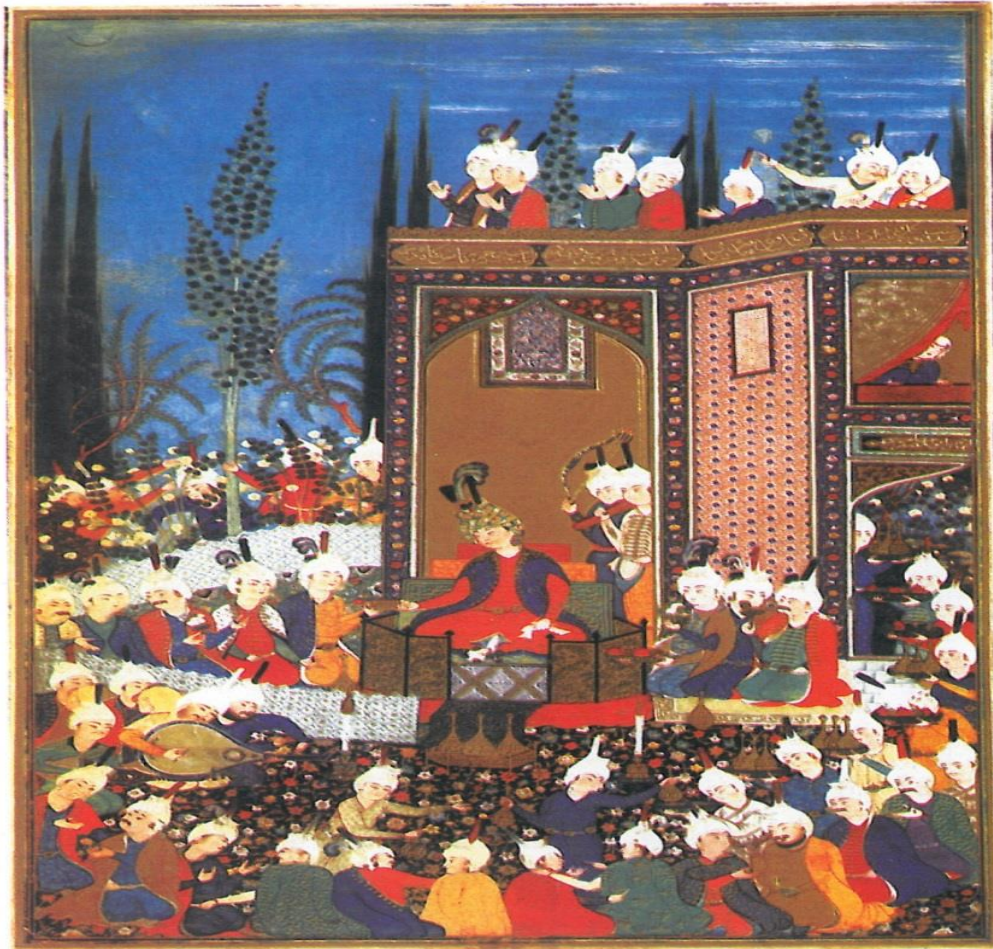
نام اثر: جشن عید فطر از دیوان حافظ نام هنرمند: به امضای سلطان محمد مکتب: تبریز اندازه: ۱۵ × ۲۰ س م تاریخ اجرا: حدود ۹۳۲ هجری قمری