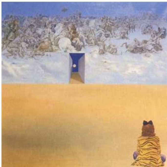
تصویر ۵- نبرد در ابرها، اثر سالوادور دالی، ۱۹۷۴ (مأخذ: www.salvador-dali.org )

نبرد در ابرها عنوان یکی دیگر از نقاشی های متأخر سالوادور دالی در سال ۱۹۷۴ می باشد که مثل اثر پیشین که به آن پرداخته شد، در اینجا نیز فیگور در پلان جلو و از پشت به تصویر کشیده شده تا نگاه بیننده را به عمق تصویر هدایت کند. خط افق، زمین و آسمان در اینجا نیز اهمیتی کلیدی در تعریف فضا و به چالش کشیدن آن برعهده دارند. نور حاکم بر فضا نور روز است و آسمان نیز به رنگ آبی روشن و ابرهای سفید درآمده، اما در قسمت تلاقی زمین و آسمان، دالی با ایجاد برشی مستطیلی کوچهای باریک را ترسیم نموده که انتهای آن آسمانی به رنگ شب است و ماه در آن به چشم می خورد. گویی آسمان تاریک شب در پس دیواری است که خود آسمان روز است و باعث می شود کلیت فضا جلوه ای خیالی پیدا کند.