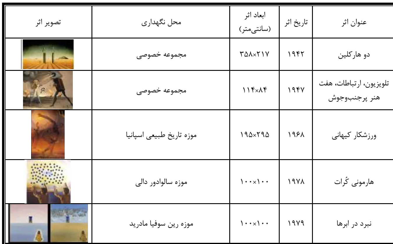
جدول (۱): نقاشی های سالوادور دالی

همچنین، جامعه ی آماری این مطالعه به لحاظ کلی آثار نقاشی هنرمند سورئالیسم، سالوادور دالی، است که در این کارها نقاش توانسته جلوه های خیال را بصری نماید. بر این مبنا، مجموعه نقاشی هایی از سالوادور دالی که به منزله ی حجم نمونه در این تحقیق گزینش شده اند، و در بخش بعد بررسی بر روی آنها صورت می گیرد، در جدول (۱) گردآوری شده است.