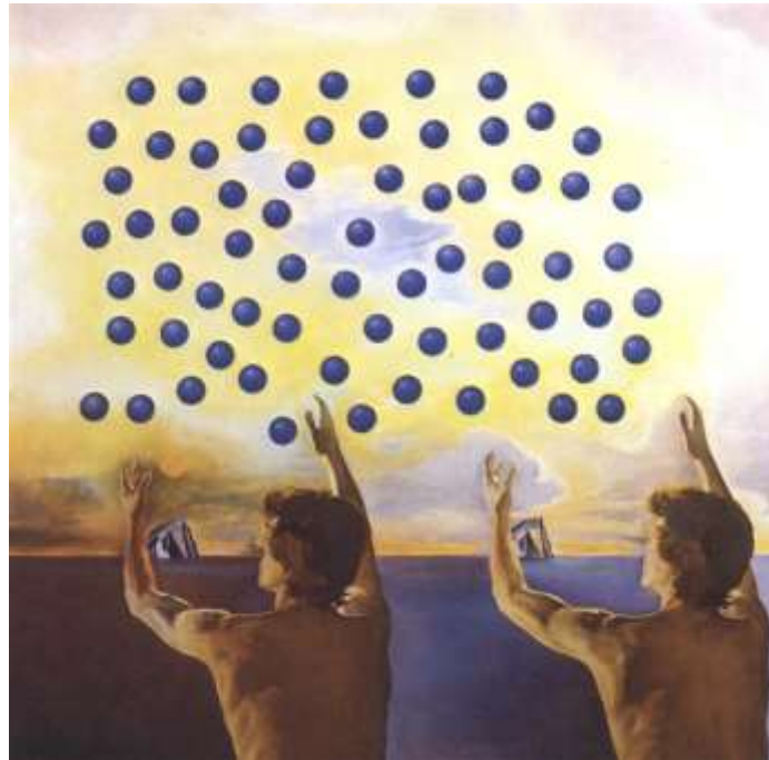
تصویر ۴- هارمونی گرات، اثر سالوادور دالی، ۱۹۷۸ (مأخذ: www.salvador-dali.org )

برخلاف آثار بررسی شده قبلی، هارمونی گرات از جمله نقاشی های اواخر دوران حرفه ای سالوادور دالی می باشد که گویی مثل نقاشی ورزشکار کیهانی (تصویر ۳) نوعی بازنمایی خیالی از نظم عالم و مفاهیم جهان شمول را به تصویر می کشد. سالوادور دالی در پیش زمینه ی تابلو نیم تنه ی دو مرد را از پشت ترسیم نموده که با حالتی مسخ شده روی به کرانه ی دریا و آسمان نهاده اند و دست هایشان را به طور مشابه به سوی آسمان گشوده اند. تعداد قابل توجهی کره ی آبی تیره، در ابعاد مساوی، با فواصلی تقریباً برابر در آسمانی به رنگ زرد مشاهده می شوند که بخش عظیمی از فضای تصویر را اشغال کرده اند. پیش تر به بخش هایی از نظریات باشلار پیرامون ماهیت متغیر