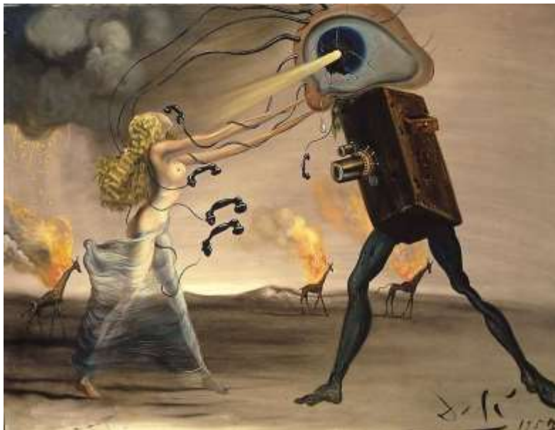
تصویر ۲- تلویزیون، ارتباطات، هفت هنر پرجنب و جوش، اثر سالوادور دالی، ۱۹۴۷ (مأخذ: www.dali.com)

سالوادور دالی نقاشی تلویزیون، ارتباطات، هفت هنر پرجنب و جوش را در سال ۱۹۴۷ به سفارش بیلی رس ۷ (کارگردان تئاتر) به خاطر استفاده در دکور یک نمایش عمومی به نام «هفت هنر پرجنب و جوش» به تصویر کشید. همان طور که در تصویر می توان دید، فضای کلی صحنه مثل دیگر نقاشی های دالی چشم اندازی با عمق میدان زیاد دارد و خط افق محل جاگیری زمین و آسمان و دیگر عناصر را مشخص می کند. با دقت در موضوع سفارش، دالی از ابژه هایی مثل گوشی تلفن، چشم شیشه ای و دوربین فیلم برداری که به تکنولوژی های ارتباطی قرن بیستم اشاره دارند در ترکیبی ملانکولیک و کابوس وار بهره می جوید. زنی تقریباً عریان در حالی که سیم های تلفن او را در آغوش گرفته دست هایش را به سمت موجود هیولامانندی که گویا استعاره ای از رسانه های نوظهور