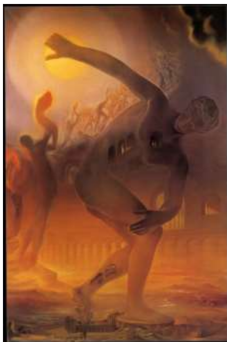
تصویر ۳- ورزشکار کیهانی، اثر سالوادور دالی، ۱۹۶۸

ورزشکار کیهانی جزء آن دسته آثار برجسته‌ی سالوادور دالی است که بارها آن را به تصویر کشید و نسخه‌ای که در اینجا به آن پرداخته می‌شود، اجرای نهایی او از این نقاشی می‌باشد که در سال ۱۹۶۸ به پایان رسید. در ورزشکار کیهانی اشاره به دوره‌ی باستان یونان آشکار است و مجسمه‌ی مشهور دیسک‌انداز میرون بخش اعظم تصویر را در برمی‌گیرد. مثل بسیاری دیگر از آثار دالی، مخاطب در ورزشکار کیهانی نیز نظاره‌گر آمیختگی عناصر طبیعت، انسان و سایر ابژه‌های نامتجانس و ناهمگون در چشم‌اندازی پرمعق است که فضایی خیالی و بی‌زمان را در برابر دیدگان تماشاگر به معرض نمایش می‌گذارد. دیسک یا گویی که در دست ورزشکار قرار گرفته است،