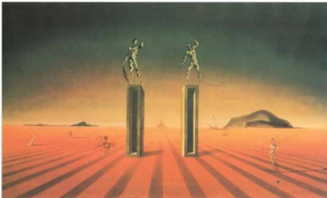
تصویر ۱- دو هارکلین، اثر سالوادور دالی، ۱۹۴۲ (مأخذ: www.artisticafineart.com)

معنی واژه‌ی «هارکلین» دلفک یا لوده است که سبب می‌شود نام تابلوی دو هارکلین با توجه به سوژه‌ی تصویر، رنگ‌وبوی کنایه‌آمیزی بیابد. همان‌طور که در تصویر مشاهده می‌شود، اینجا نیز خط افق و کوه‌های دور دست در جهت القای عمقی بی‌نهایت در فضای نقاشی ترسیم گشته‌اند و خطوط راه‌راه زمین بر تشدید عمق تصویر در پرسپکتیوی تک‌نقطه‌ای در مرکز کادر افزوده است. دو مجسمه (با ژست‌هایی مثل مجسمه‌های دوران باستان) بر دو پایه‌ی بلند طوری مستقر شده‌اند که به نظر می‌رسد بدن‌های آنها از فرم‌هایی لوزی‌شکل و هم‌اندازه شکل گرفته است و پایه‌ی بلندی که زیر پای آنها قرار گرفته است، شکوه و عظمتی هرچند پوشالی، به چشم‌انداز