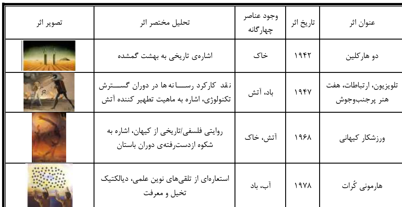
جدول (۲): خلاصه تحلیل نقاشی‌های سالوادور دالی

نگارنده پس از تحلیل جامع و دقیق که با رویکردی توصیفی-تحلیلی پنج اثر از دوره‌های مختلف کاری سالوادور دالی توأم بود، در ادامه برای بستاری بر بحث‌های صورت گرفته جدولی به اختصار گردآوری نموده که ذیل می‌توان آن را مشاهده کرد.