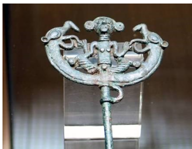
تصویر ۲: oi.uchicago.edu

الیه یا پهلوان یا فردی ایرانی (رام کننده جانوران): نمادی است که در تندیشه کهن ایرانی وجود داشته و از ۲۷۰۰ قبل از میلاد در هنر جیرفت بسیار به کار می رفته.