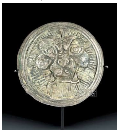
تصویر ۵: یافته شده از سرخ دم کوهدهشت oi.uchicago.edu

در لرستان شیر مهمترین نماد جنگاوری و نیروی مردانه بوده، هنوز هم بر گور دلاوران در گذشته تندیس شیر می نهند.