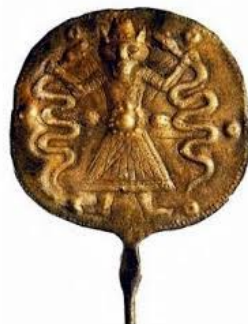
تصویر ۴: یافته شده از سرخ دم کوهدهشت oi.uchicago.edu

۲: شیر « نمادی از خورشید، خوبی، روشنایی، هوشیاری و نیرو، قانون، و دادگری بوده است» (فضائلی، ۱۳۸۷، ۹۸). «شیر در اندیشه مردمان خاور باستان، نماد شهریاری و دلاوری است، چونان که نامش بر بسیاری از شاهان نهاده شده است. نمادی سلطنتی و نشانه ای از شجاعت و قدرت. مصریان از سربزرگداشت، نام هخامنشی را با نگاره شیر می نوشتند و شاهنامه اشاره به نشستن شیر بر درفش ایران دارد. سرسرایانوان بر دوشش تخت شاهان بر پنجه اش استوارند. بر در نیایشگاه ها به نگهداری می ایستند و نقش کنده شده بر سنگش، چون نیرویی محافظ بر گردن آویخته می شود. شیر نماد رده چهارم آیین مهر است و در مهر آوه ها تندیس خدای رمزآلود با سر شیر یافت می شوند. مصریان نیز خدای بانوی جنگاور شیرسر، سخمت را می پرستیدند» (طاهری، ۱۳۹۱، ۹۲).