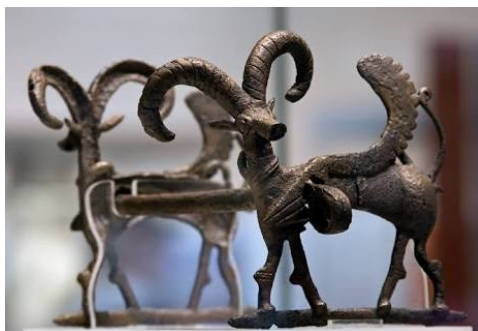
تصویر شماره ۶: یافته شده از سرخ دم کوهدشت

جانوران همزیست با انسان در این منطقه بود، حضورش در میان طرح های هنری عجیب نیست. به نظر جوزف کمبل «بز شاید نماد قدرت مذکر باشد» (گدار، ۱۳۷۷، ص ۲۵۳).