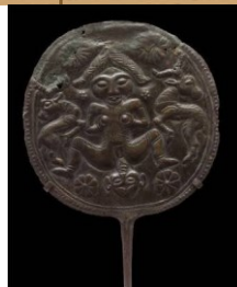
تصویر ۳: یافته شده از سرخ دم کوهدشت oi.uchicago.edu