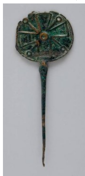
تصویر ۸: در سرخ دم کوهدشت oi.uchicago.edu

این نقوش در سنجاق های لرستان بسیار گوناگونند. گاهی به شکل نقطه های بزرگ و کوچک هستند. گاه نقطه های دایره ای که در میان طرح جمع شده اند. گاهی نقطه های گرد که از مرکز شروع شده و به انتها ختم شده اند. در برخی از آثار نیز به خط های موازی، هاشور یا مارپیچ و اریب بر میخوریم.