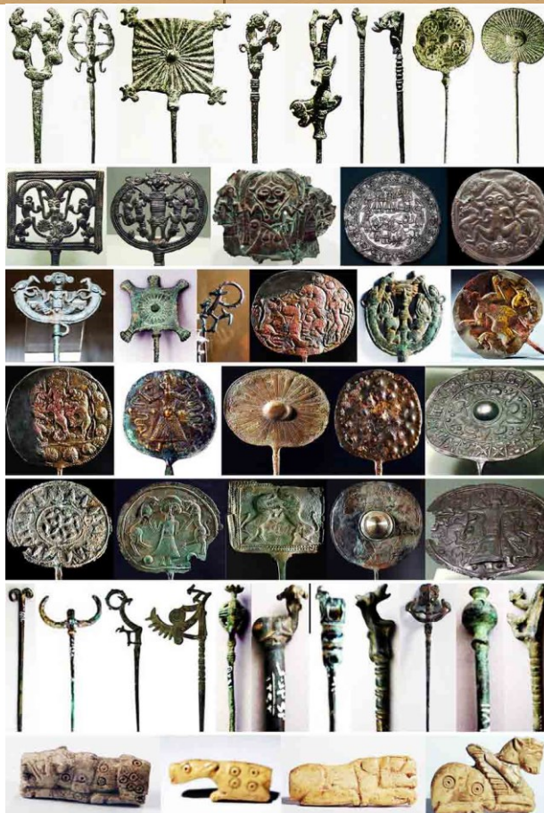
تصویر ۱. نمونه هایی از سنجاق سرها oi.uchicago.edu

ردیف اول: موزه بستونو مجموعه داوید ویل ردیف دوم: موزه لوور، کیولند و زوریخ و دیگر آثار: موزه ملی ایران