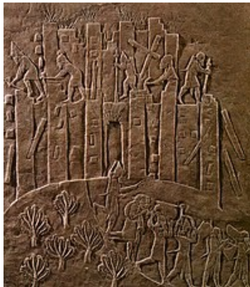
شکل ۷ - تصویری از فعالیت جامعه و اهمیت گیاه در Tamadonema.ir