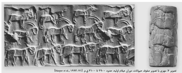
تصویر ۷. مهری با تصویر صفوف حیوانات، دوران عیلام اولیه، حدود ۲۹۰۰ تا ۳۱۰۰ ق.م. [Harper et al., ۱۹۹۲: ۷۱]